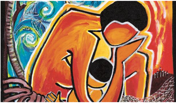
„Cyclon PAM II. 13th of March 2015“ (Detail); © Juliette Pita