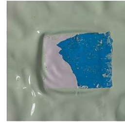
2. [umgangssprachlich] etw. nicht näher Bezeichnetes

Samstag, 17.04.2021, 19 Uhr bis Mittwoch, 09.06.2021, 20 Uhr Hospitalhof Stuttgart, Büchsenstr. 33 70174 Stuttgart