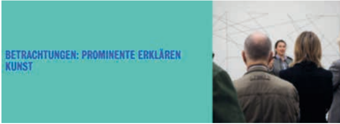
Bild: Ausstellungsansicht, © Kunstmuseum Stuttgart, Claudia Magdalena Merk, Ausstellungsansicht »Frischzelle_27«