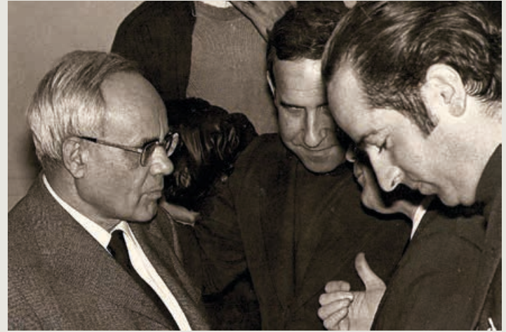
© Von Jesromtel – Eigenes Werk, CC BY 3.0, https://commons.wikimedia.org