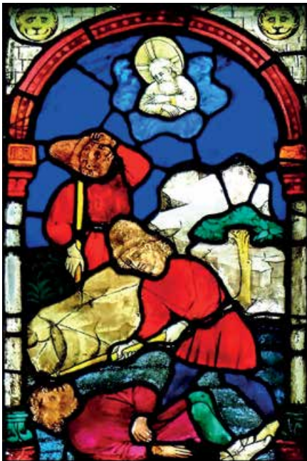
Wikipedia: Kain erschlägt seinen Bruder Abel, Glasfenster von Hans Acker im Ulmer Münster (um 1430)

ANMELDUNG: Citykirchenbüro, Tel. 0711/2068-317, citykirchen-stuttgart@elk-wue.de, Anmeldung erforderlich, begrenzte Teilnehmerzahl (12 Personen). KOSTENBEITRAG: 20,00 €.