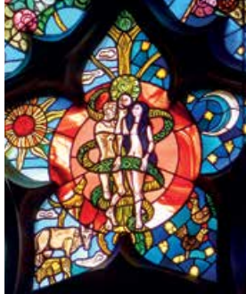
Rosette Leonhardskirche