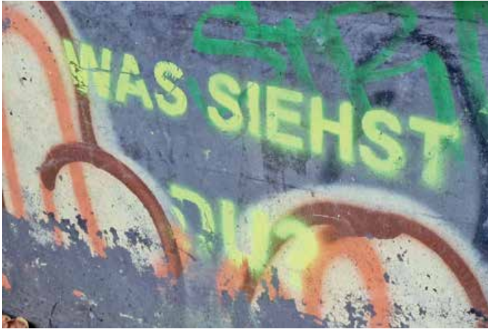
In der Stadt unterwegs mit einem anderen Blick