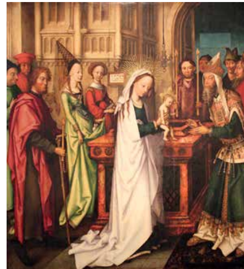
Darstellung des Herrn (Hans Holbein der Ältere, 1501, Hamburger Kunsthalle)

ANMELDUNG: Citykirchenbüro, Tel. 0711/ 2068-317, citykirchen-stuttgart@elk-wue.de, Anmeldung erforderlich, begrenzte Teilnehmerzahl (12 Personen). KOSTENBEITRAG: 20,00 €.