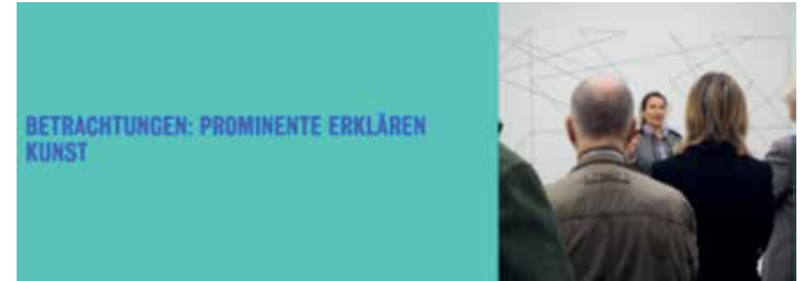
Bild: Ausstellungsansicht, © Kunstmuseum Stuttgart, Claudia Magdalena Merk, Ausstellungsansicht »Frischzelle_27«