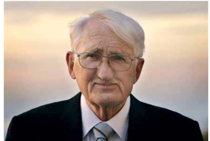
Spiegel, Foto: Oliver Berg/ picture-alliance/ dpa Urheberrecht: Verwendung weltweit, usage worldwide